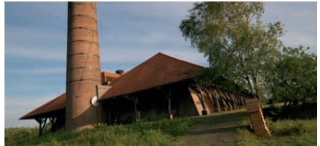
De oude steenfabriek

De visie van Phanos voldoet aan de uitgangspunten die Arnhem heeft opgesteld voor het gebied en respecteert de eigenheid ervan. Tevens zijn er mogelijkheden voor experimenteel bouwen (EMAB-status) met oog voor de rivier, de bewoners en de natuur. De cultuurhistorie wordt letterlijk weer voelbaar. Stadsblokken-Meinerswijk wordt de ontmoetingsplek voor noord en zuid, maar het doet meer dan dat. Het zet Arnhem neer als stad in en aan het water.