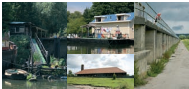
De huidige situatie

Door in Arnhem Zuid te bouwen, heeft Arnhem al eerder gekozen om uiterwaardgebied voor woningbouw te benutten. En hoewel de Rijn langs en inmiddels door Arnhem stroomt, heeft de stad nooit echt de wending naar de rivier gemaakt. Zo heeft Arnhem Noord zich altijd gericht op de, noordelijk van de stad gelegen, Veluwe. Men zegt wel dat Arnhem Noord met zijn rug naar de Rijn ligt. Stadsblokken-Meinerswijk kent echter een enorme ontwikkelingspotentie die Arnhem meerwaarde kan geven. De laatste jaren zijn er allerlei initiatieven geweest om iets met het gebied te gaan doen. Om verschillende redenen is tot op heden geen enkel plan gerealiseerd.